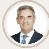
Beşir Acar Vergi Hizmetleri Başkanı