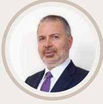
Nazım Hikmet Denetim Hizmetleri Başkanı